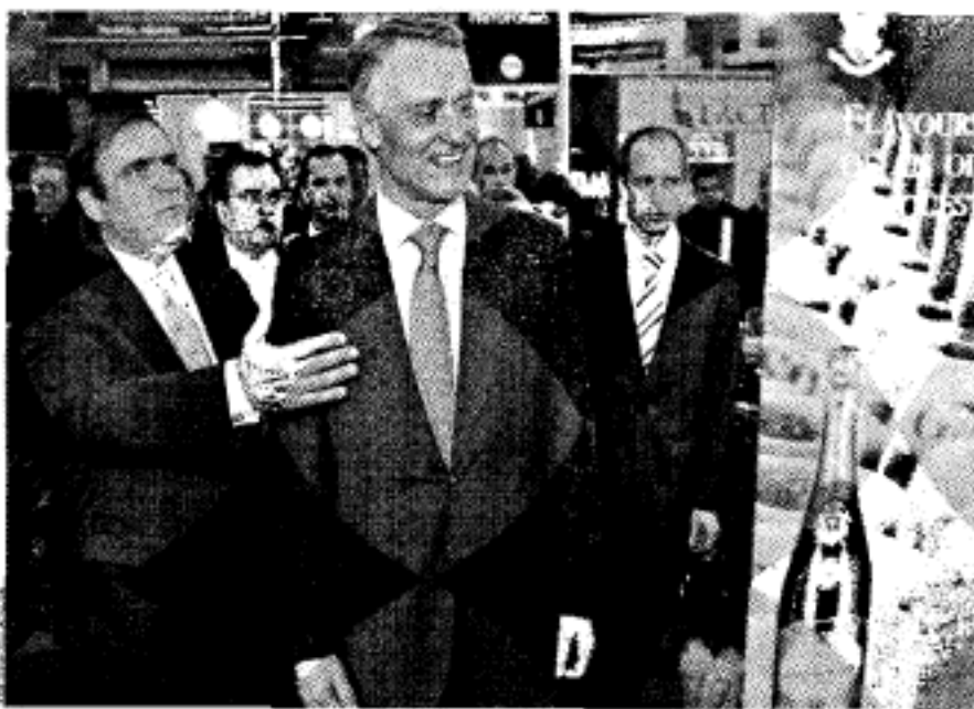
Cavaco Silva visitou o SISAB e apelou aos emigrantes para promoverem o "nacional"

Para a Alemanha – destino de 12,6% das vendas ao exterior, o comércio caiu 0,5% no mesmo período, um movimento que se agravou nos últimos meses de 2008. Em Novembro, os exportadores nacionais per-